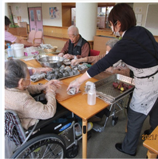
Eating & talking