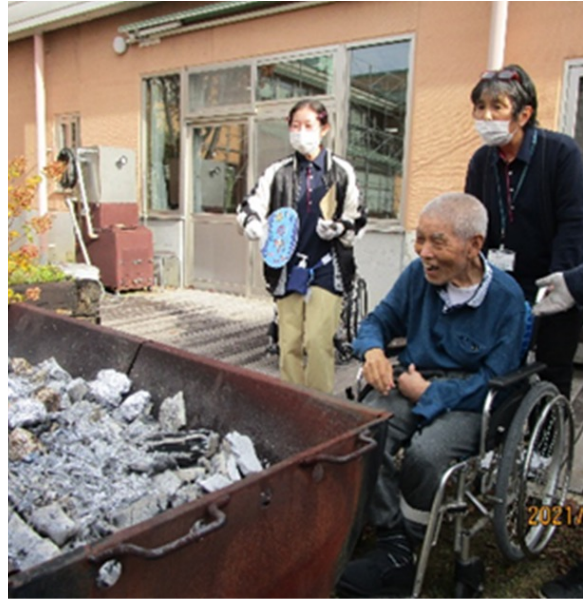
Roasted sweet potato on the fire