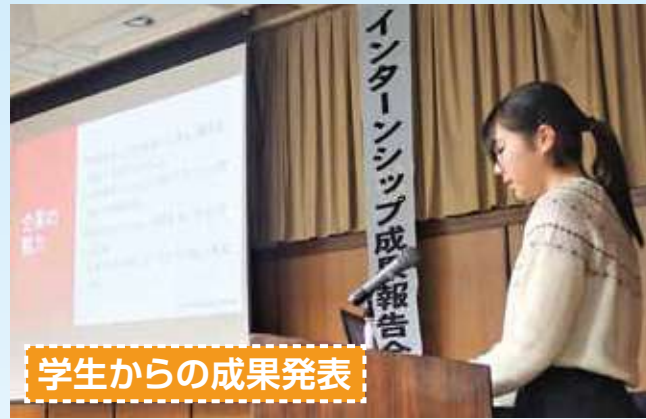
学生からの成果発表